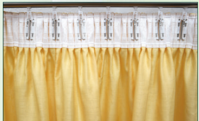
6 Aufhängung mit Metallhaken und Haken | hanging with metal hooks and hooks