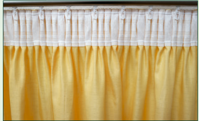
2 Nutzung von Haken | use of hooks