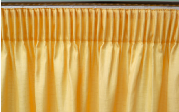
1 Bleistiftfalten durch Ziehen der 2 Zugschnüre | pencil pleats by pulling the 2 cords