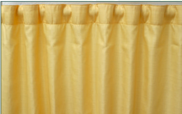
3 Wellen durch Nutzung der Schlaufen | waves by using the loops