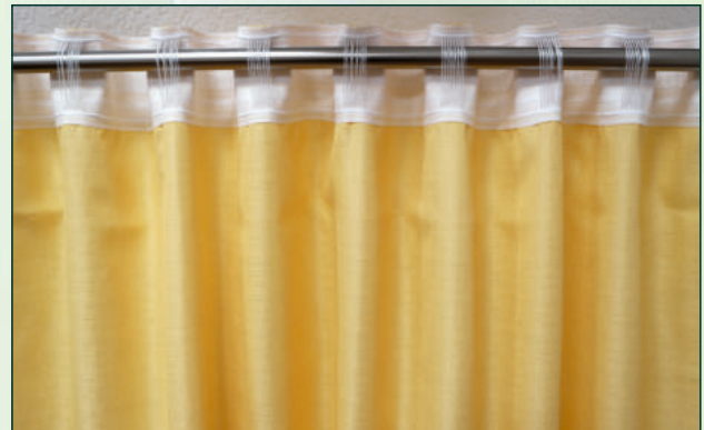
4 Verwendung der Schlaufen | using the loops