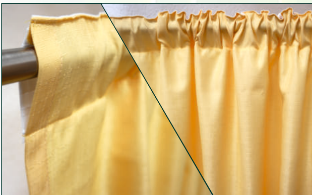
5 Nutzung des genähten Tunnels | use of the sewn tunnel