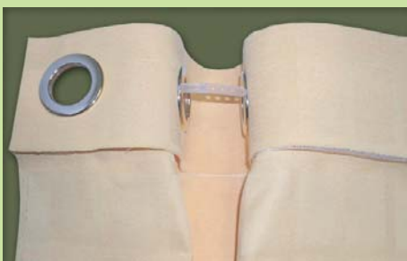
Verbinden der Abstandshalter (Regulierung des Stoffverbrauchs)/ connect distance holder (regulation of fabric fullness)