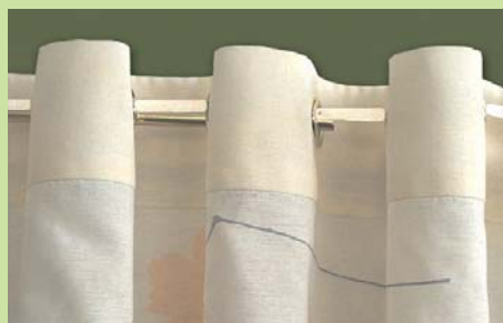
Fertige Dekoration (Rückansicht)/ finished decoration (back view)

Abstandshalter/distance holder Art. Nr./art. no. 31055