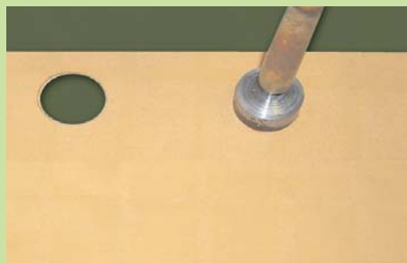
markierte Löcher mit Heißschneider (z.B. Art. Nr. 31052 + 31053) ausschmelzen*/ melt out marked holes with hot cutter (e.g. art. no. 31052 + 31053)