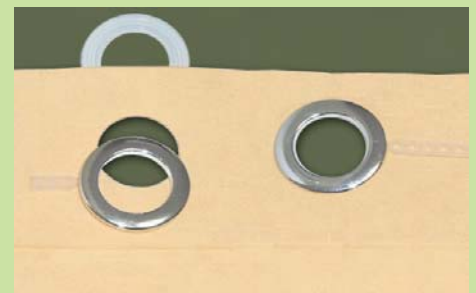
Ösen einlegen und bei Bedarf Abstandshalter (Art. Nr. 31055) einclippen/ put in eyelets and clip in distance holder (art. no. 31055) as needed