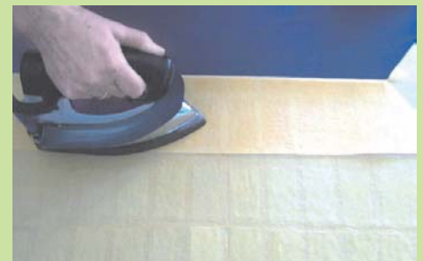
Stoff anbügeln und Saum schließen/ iron fabric and close the hem

And this is how to do your decoration in a few steps: