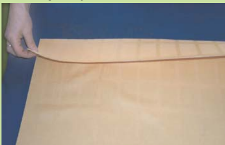
gesäumten Stoff umbügeln/ turn over seamed fabric and steam up