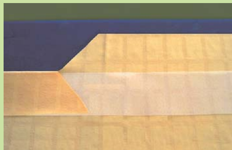
beschichtetes Nahtband einlegen (z.B. Art. Nr. 20550/100)/ insert coated seam tape (e.g. art. no. 20550/100)