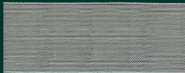
Aufmachung/packaging: 50 m Rolle/roll

Verarbeitungshinweise S. 38/ usage tips side 38